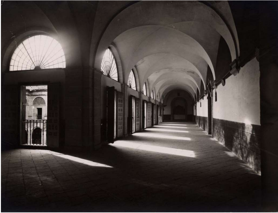
1.0137-, Interior del claustro alto del monasterio de San Millán de la Cogolla, de Yuso, San Millán de la Cogolla, 1900-1929, copia positiva sobre papel.