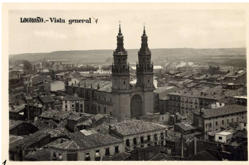
1.3495- G. H. Alsina Mágina, Vista general de la concatedral de Santa María de la Redonda y la ciudad de Logroño, Logroño, 1929, tarjeta postal. “